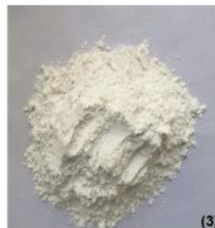
(1) 二氧化硅 (SiO 2 ) 结构; (2) 结晶二氧化硅; (3) 无定形二氧化硅